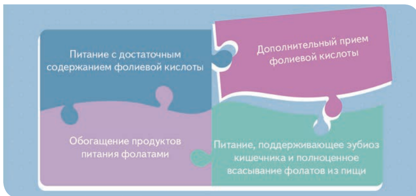
РИС. 2. СТРАТЕГИИ НОРМАЛИЗАЦИИ ФОЛАТНОГО СТАТУСА

Вне беременности дефицит фолатов формирует малые симптомокомплексы, значительно снижающие качество жизни и ухудшающие самочувствие женщины (астения, дисфорические нарушения и ухудшение памяти, угнетение секреторного звена иммунной системы, нездоровый цвет лица, тусклые и ломкие волосы). Нормализация фолатного статуса (рис. 2) вне беременности стимулирует кроветворение, состояние иммунной системы путем активации синтеза иммуноглобулинов М и А, стабилизирует настроение путем стимуляции обмена серотонина, улучшает состояние кожи и волос [21].